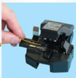
2. Размещение волокна