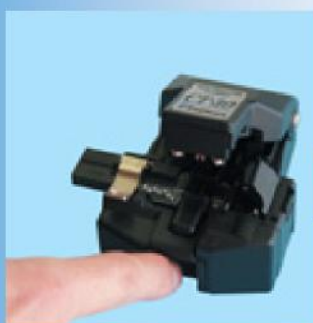
1. Установка ножа