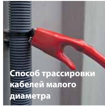
Способ трассировки кабелей малого диаметра