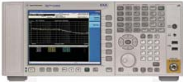
Анализатор сигналов экономичного класса Agilent EXA, обладающий беспрецедентным для приборов этого класса быстродействием, точностью и широким набором прикладных измерений.