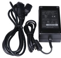
Сетевой блок питания