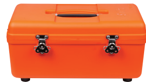
Чемодан для переноски