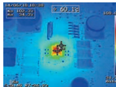
Отладка электронных схем с помощью U5855A