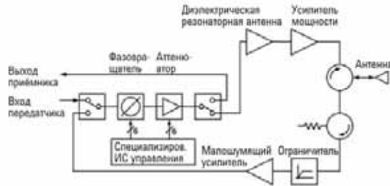
Рисунок 2 – T/R модули являются главными связующими устройствами между антенной РЛС и приёмником. Активные компоненты – фазовращатели и переменные аттенюаторы требуют испытания в нескольких состояниях.

Правильная оценка рабочих характеристик каждого T/R модуля требует целого ряда измерений (рисунок 2). Поскольку T/R модуль является входным устройством приёмника, для него требуется типовой набор измерений, таких как измерение коэффициента шума, частотной характеристики, коэффициента усиления и согласования по входу.