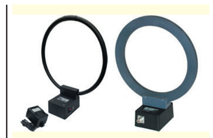
Рис. 1. Рамкові антени

Для вимірювання напруженості магнітного поля на низьких частотах нижче 30 МГц ідеально підходять рамкові антени (рис. 1). Вони являють собою, як правило, круглу рамку або котушку; частота, на якій працює антена, залежить від розміру і числа витків рамки.